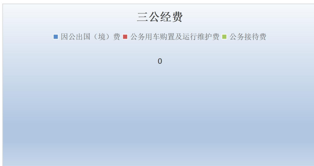
（图7：“三公”经费财政拨款支出结构）（饼状图）

1、因公出国（境）经费支出0万元，完成预算0%。决算数与预算数持平。因公出国（境）费支出决算较上年增加0万元，增长0%。全年安排因公出国（境）团组0次，出国（境）0人。