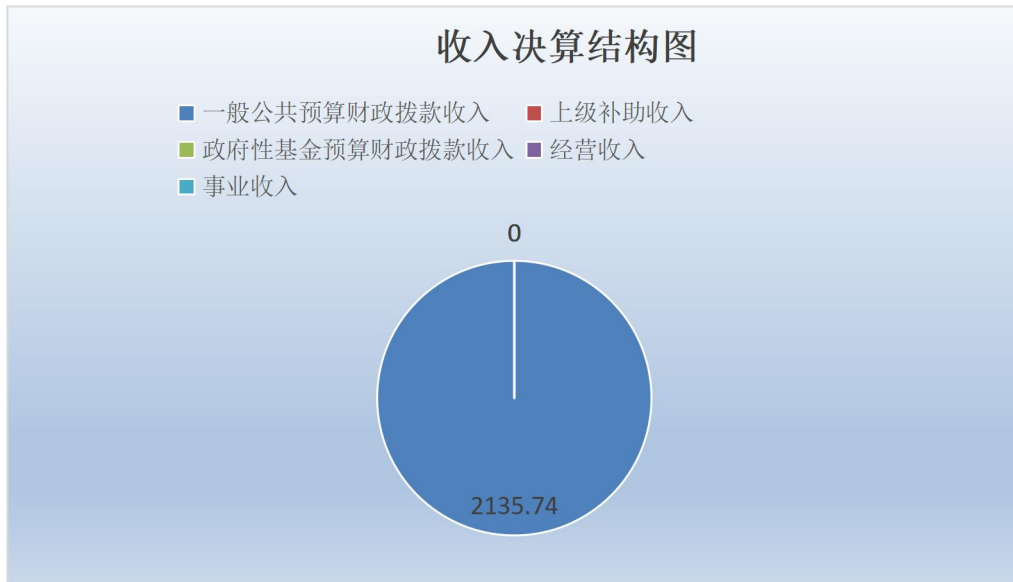
（图 2：收入决算结构图）（饼状图）